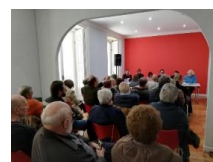
Homenaje a Javier Navascués